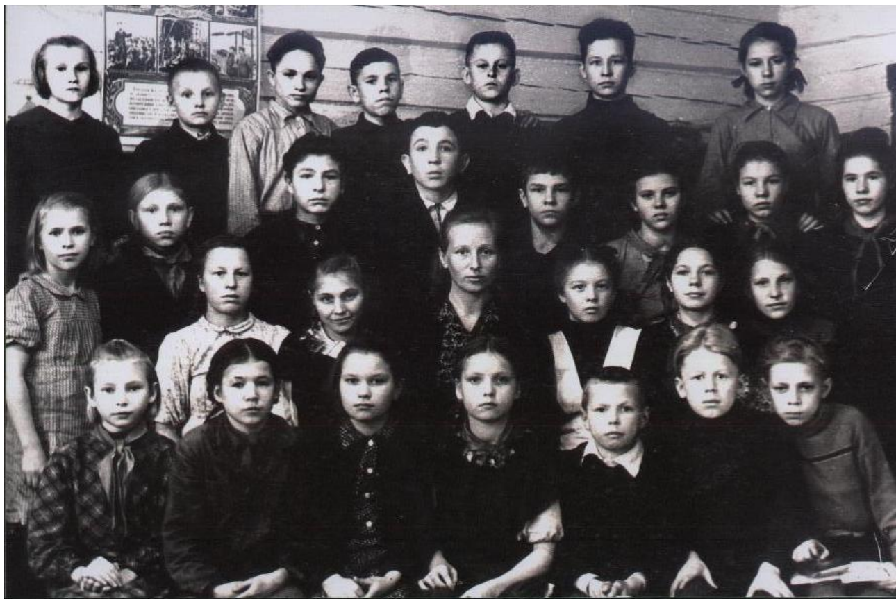
Фото 1952 года, 7а класс